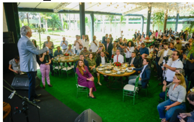
Governador Ronaldo Caiado discursa para executivos, gestores e jornalistas

Ao iniciar seu discurso, Caiado disse que alguém fazia falta na imprensa goiana. Em seguida, revelou como era íntimo do fundador do Diário da