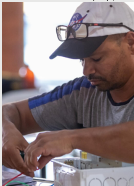
As inscrições estão sendo realizadas no CRAS Lunabel, CRAS Pedregal ou CREAS Pedregal