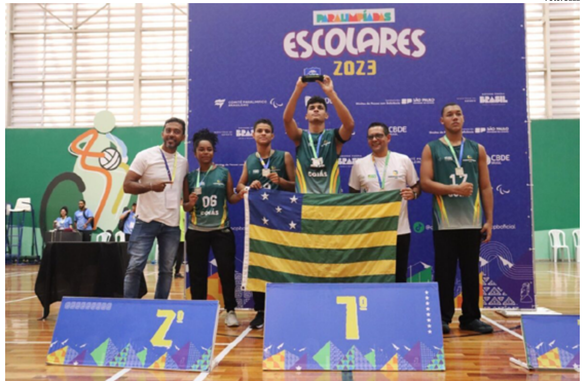
Atletas de Goiás conquistaram medalhas em sete modalidades diferentes dos jogos, disputados em São Paulo

ticipar desta conquista. Goiás nunca tinha chegado nesta final no vôlei sentado e fazer parte disso é muito emocionante, junto com toda a equi-