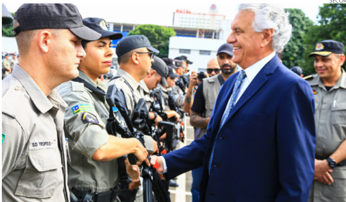
Atlas da Violência aponta queda de 18% em taxa de homicídios entre 2020 e 2021, a terceira maior do país

Se comparado com 2018, a redução dos homicídios em Goiás é maior: 35%. Conforme a pesquisa, o número total de homicídios também registrou diminuição semelhante