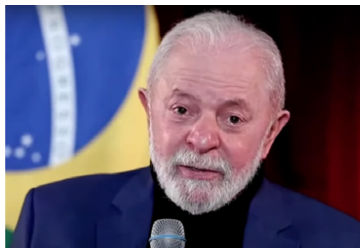
Lula da Silva: divergências ideológicas com presidente eleito da Argentina

O presidente eleito da Argentina, que se mostrou mais pragmático após a sua eleição, tentou se aproximar de Lula com um gesto, ao convidá-lo formalmente para sua posse. Em 26 de novembro, Milei enviou a Brasília Diana Mondino, sua futura ministra das Relações Exteriores, que fez ao chefe da diplomacia brasileira um convite “para que o presidente Lula participe” da cerimônia, segundo as mesmas fontes.