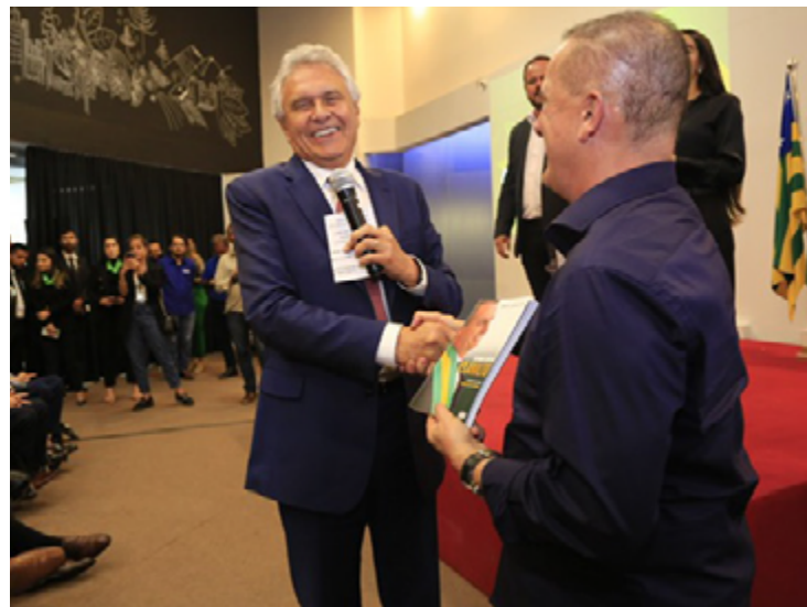
Ronaldo Caiado e Onyx Lorenzoni: trajetória de Jair Bolsonaro