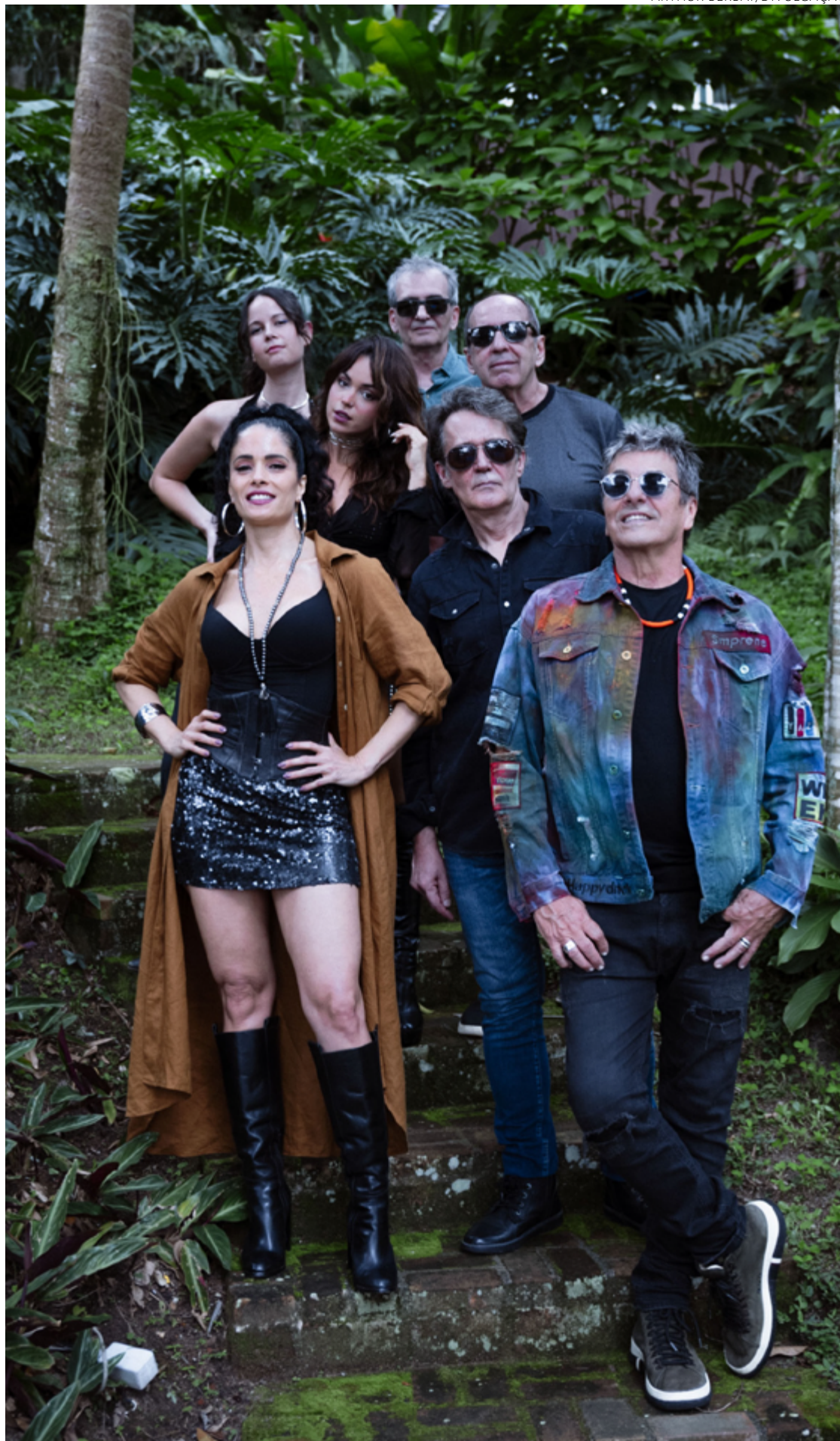
Blitz: com disco novo, banda carioca, percussora do BRock, apresenta em pub goianiense repertório de sucessos

Blitz e Barão nasceram de uma costela do grupo teatral Asdrúbal Trouxe o Trombone. No início dos anos 80, as duas bandas protagonizaram shows eletrizantes no palco do Circo Voador. Se o grupo que contava com Cazuza à frente era uma pauleira só, a Blitz tinha duas garotas bonitas cantando. "Tem também guitarra (discreta), baixo, teclados e bateria. Ei, não é aquele baterista grandalhão que tocava com a Marina? No microfone, um ator, como é mesmo o